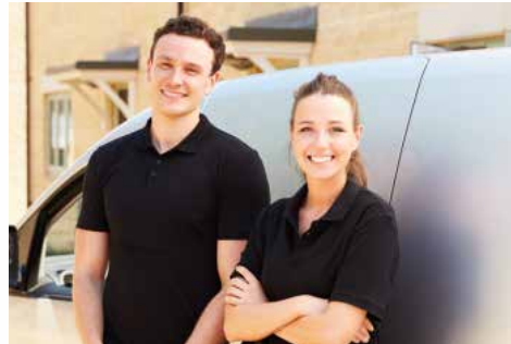
Y camau cyntaf i hunangyflogaeth