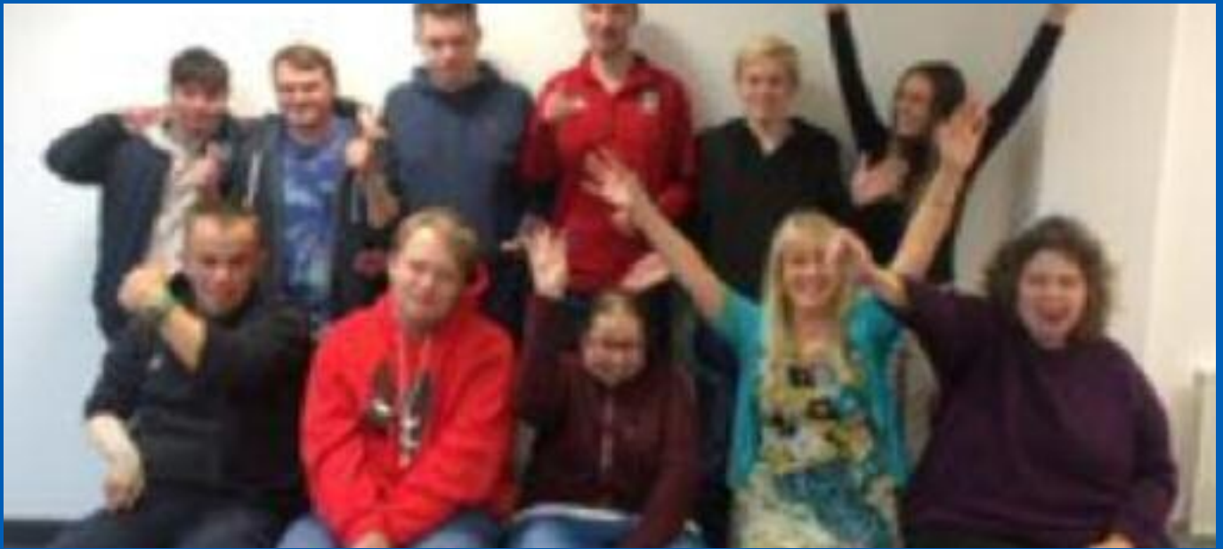
Interniaethau â Chymorth Engage to Change Gateway to Employment

Mae'r rhaglen yn bartneriaeth amlasiantaeth rhwng Cyngor RhCT, Coleg y Cymoedd, Anabledd Dysgu Cymru, Engage to Change ac Elite Supported Employment. Mae'r interniaeth â chymorth wedi rhoi profiad gwaith i unigolion ar draws amrywiaeth o adrannau Cyngor RhCT i ddatblygu sgiliau sy'n gysylltiedig â'r gwaith i'w helpu nhw i sicrhau cyflogaeth.